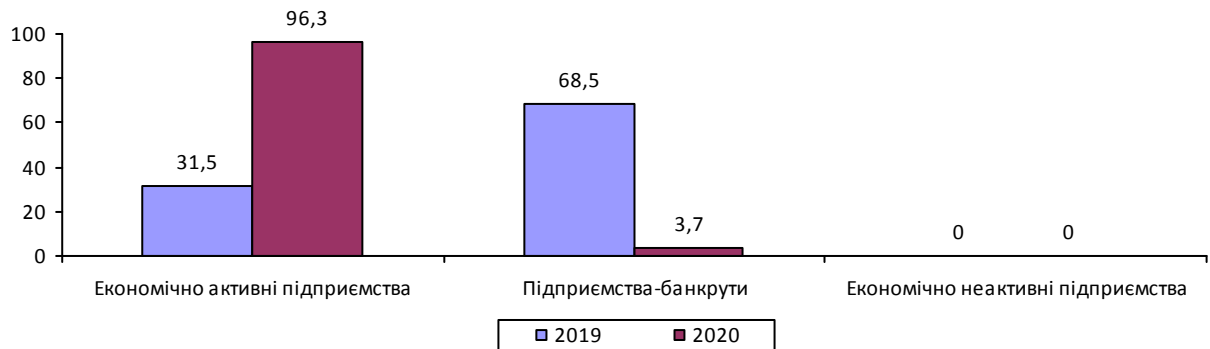
Структура заборгованості з виплати заробітної плати на 1 вересня 2019–2020 років (у % до загальної суми)

Заборгованість працівникам економічно активних підприємств у серпні 2020р. зменшилася на 23,3%.